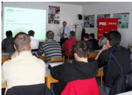
Ředitel společnosti při únorovém setkání