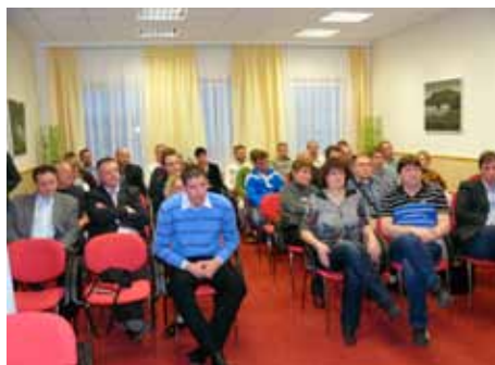
Setkání s našimi prodejci