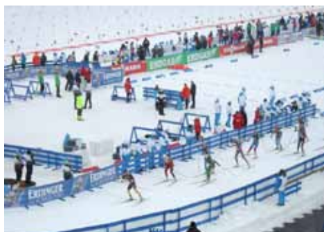
Biatlon prověřený Vysočinou