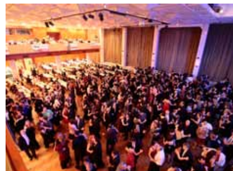
Proběhl ples skupiny PKS