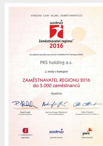
Certifikát „Zaměstnavatel regionu 2016“