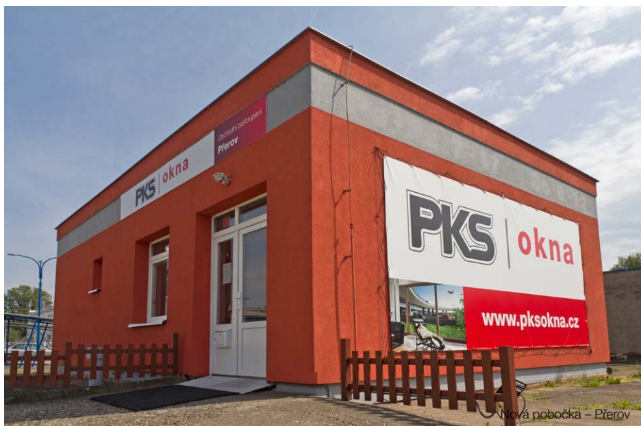
Nová pobočka – Přerov

Kontakty na pobočku, fotky a virtuální prohlídku najdete zde: http://www.pksokna.cz/pobocka-prerov