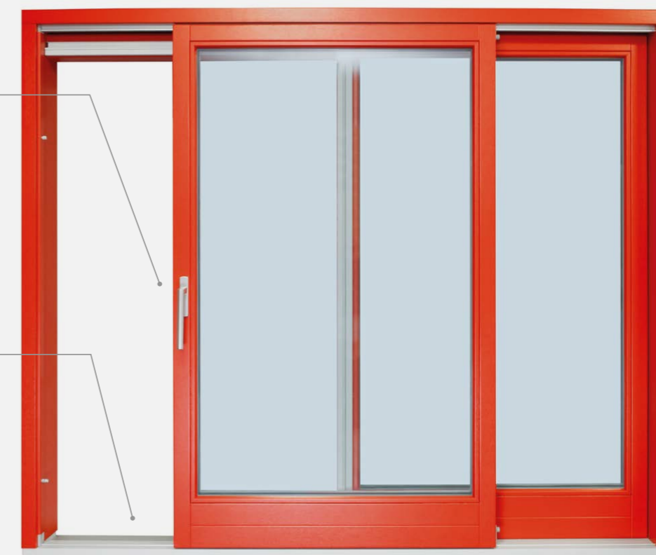
Dřevěné zdvižně posuvné dveře Výrobce: PKS okna a.s.

Video jak ovládat zdvižně posuvné dveře najdete zde: http://www.pksokna.cz/produktova-video