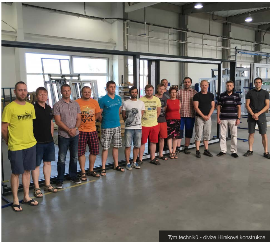
Tým techniků - divize Hliníkové konstrukce

Pro pracovní vytížení přemíra volného času nezbývá. Ten převážně dělím mezi rodinu a v rámci možností mezi jednak pasivní a jednak aktivní rekreační sport. Poslouchám metalovou hudbu, které každoročně věnuji dva dny řádné dovolené.