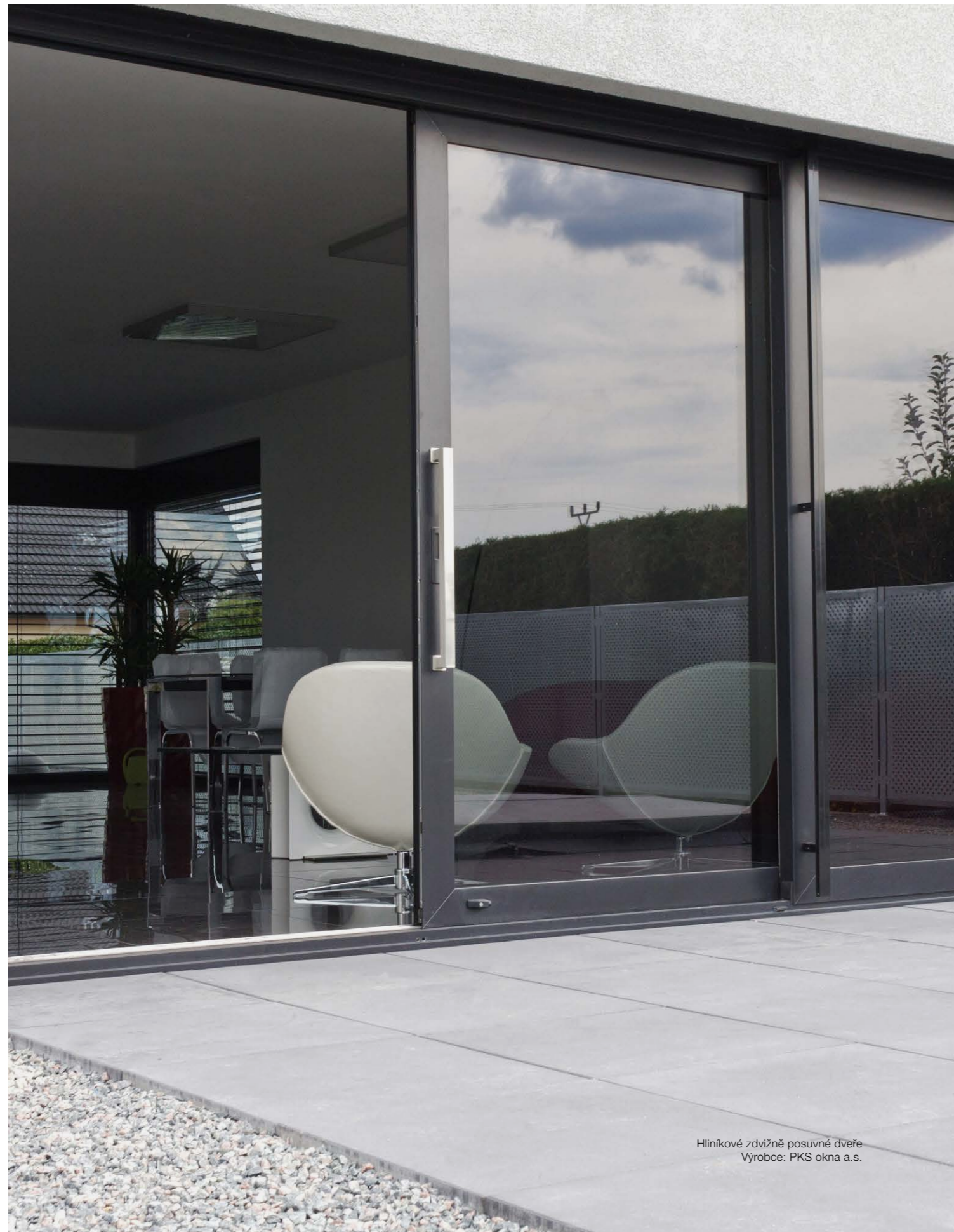
Hliníkové zdvižně posuvné dveře Výrobce: PKS okna a.s.