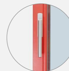
Klika pro jednoduché ovládání