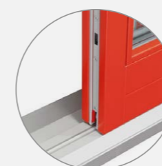
Bezbariérový práh pro lepší průchod