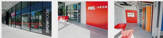
Showroom PKS okna v Praze – Karlíně

Samozřejmě můžete výběr zkontrolovat přímo s přítomnými odborníky, kteří vám poradí a doporučí řešení přesně pro vás. Nový showroom naleznete v Praze 8 na ulici Rohanské nábřeží, v obchodně administrativním komplexu River Garden III.