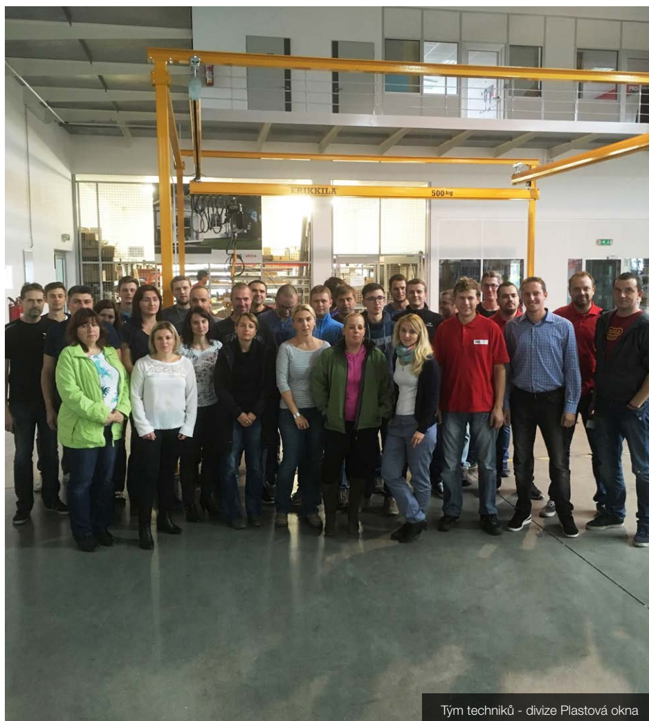
Tým techniků - divize Plastová okna

Pocházím z Uhlířských Janovic na Kutnohorsku a v současné době žiji se svojí rodinou ve Velkém Meziříčí. K mým koníčkům patří zejména výroba ze dřeva a následuje jakékoliv kutilství. V posledních dvou letech jsem se začal zabývat včelařením a s tím spojenou rekonstrukcí kočovného vozu a výrobou včelích úlů.