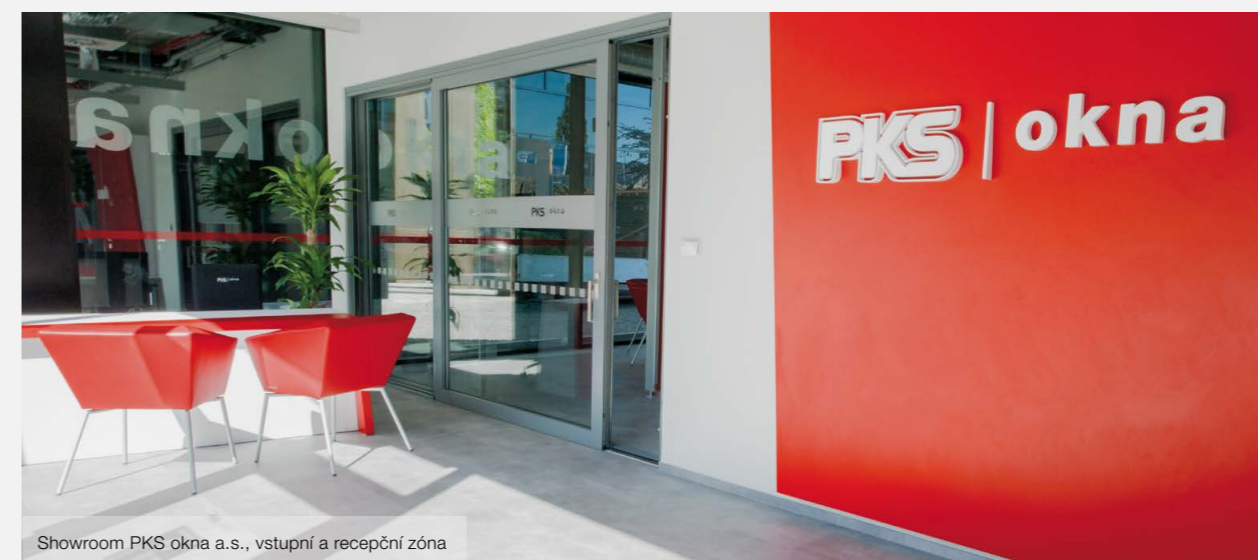
Showroom PKS okna a.s., vstupní a recepční zóna

Společnost PKS okna se svojí činností, spojenou s dosažením ročního obrátu cca 680 mil. Kč, řadí do skupiny těch největších výrobců stavebních výplní v rámci ČR. Více informací o společnosti a o produktech najdete na www.pksokna.cz .