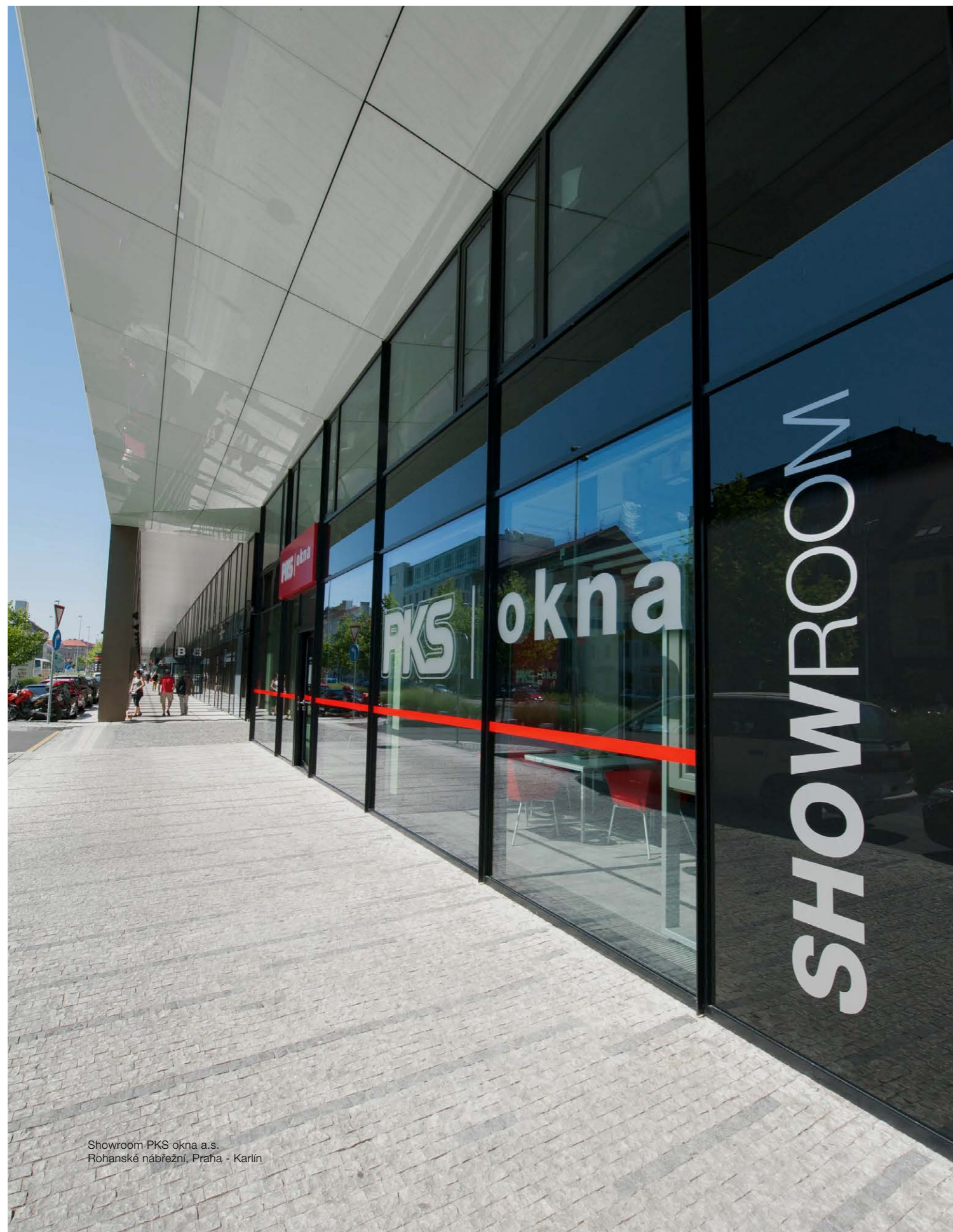
Showroom PKS okna a.s. Rohanské nábřeží, Praha - Karlín